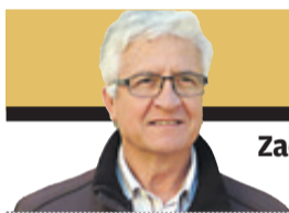
Zacarías Cerezo Texto e ilustración

■ La Obra Social La Caixa destinó un total de 18.546.000 millones de euros durante 2012 a 947 proyectos sociales que han beneficiado a más de 268.000 personas en toda España, sobre todo, colectivos vulnerables o en riesgo de exclusión, según informaron ayer fuentes de la entidad. En Murcia se pusieron en marcha 40 proyectos, por 842.800 euros. El presidente de La Caixa y de la Obra Social La Caixa, Isidro Fainé, expresó la satisfacción de la entidad por haber contribuido «una vez más» al desarrollo de iniciativas sociales que pretenden ayudar a construir una sociedad «más justa e igualitaria». «Nuestro compromiso social a lo largo de hace más de cien años es una de las señas de identidad que mejor definen La Caixa, añadió Isidro Fainé.